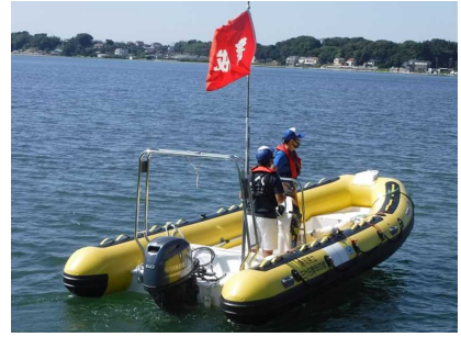
監視艇・救助艇の 2艇が随行

三ヶ日青年の家所員は、実施に先立ち、安全な操船となるよう、全乗船者に乗船前に、オールの扱い方や万が一落水したときの対応などを指導します。