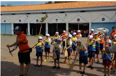
操船方法（オールの扱い方）や掛け声、 落水時の対応を事前指導